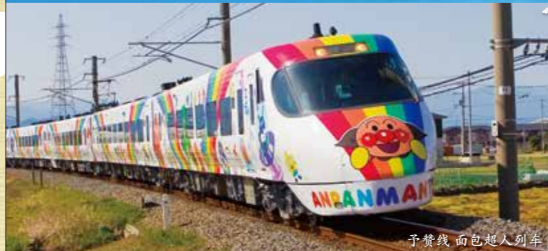
予赞线 面包超人列车