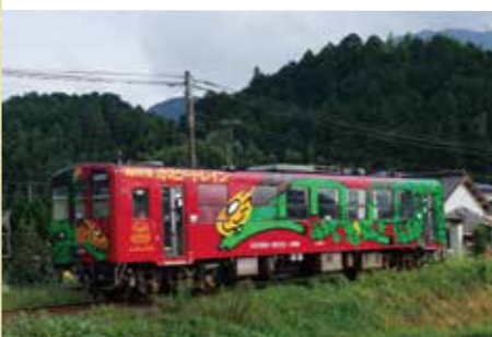
가이요도 하비 트레인

❤️ 🔍 운행일: 주말, 공휴일 #운행구간: 마쓰야마 역<=>이요오즈 역・마쓰야마 역<=>아와타하마 역