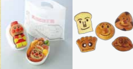
호행맨 빵과 도시락

📄 자유석(ALL SHIKOKU Rail Pass 로 승차가 가능합니다.) 📄 지정석(지정석권의 구입이 필요합니다. 지정석 회수권으로도 이용하실 수 있습니다.) 📄 그린 차량(별도 요금이 필요합니다.)