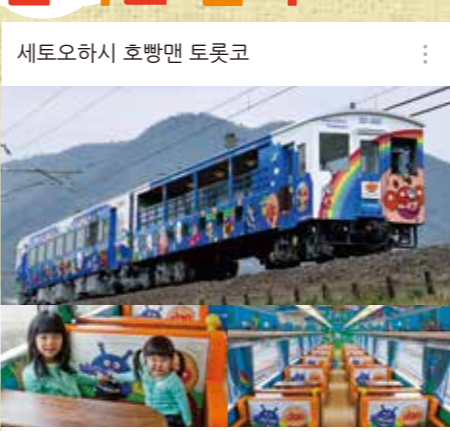
세토오하시 호행맨 토롯코

❤️ 🔍 운행일: 주말, 공휴일, 불방학, 골드위크, 여름방학을 중심으로 운행 예정. 단, 동절기에는 운행하지 않습니다. #운행구간: 다카마쓰 역 / 고토하라 역 - 오카야마 역