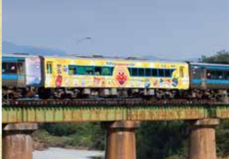
고토쿠선 / 도쿠시마선 유유 호행맨 카

❤️ 🔍 운행일: 주말, 공휴일, 불방학, 골드위크, 여름방학, 겨울방학, 연말연시 기간을 중심으로 운행 예정. #운행구간: 다카마쓰 역<=>도쿠시마 역, 도쿠시마 역 - 아와이케다 역