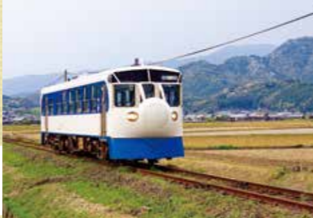
철도 하비 트레인

❤️ 🔍 운행일: 주말, 공휴일, 불방학, 골드위크, 여름방학, 겨울방학, 연말연시 기간을 중심으로 운행 예정. #운행구간: 다카마쓰 역<=>도쿠시마 역, 도쿠시마 역 - 아와이케다 역